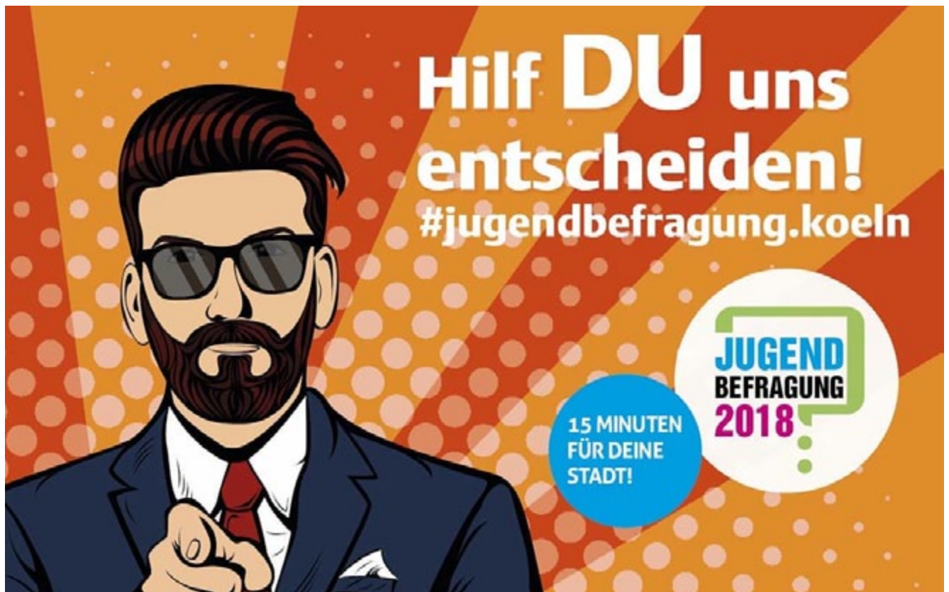
Kampagne zur Jugendbefragung 2018

„Die Durchführung einer Jugendbefragung in Köln war sehr wichtig, da man so auf einen Blick sieht, was die Kinder und Jugendlichen in Köln wollen, wie sie ihre Freizeit gestalten und was nötig ist, dass Köln zu einer kinder- und jugendfreundlichen Kommune wird. Mein großer Wunsch ist, dass die Anliegen aufgenommen werden und auch auf die Verbesserungsvorschläge angemessen reagiert wird“.