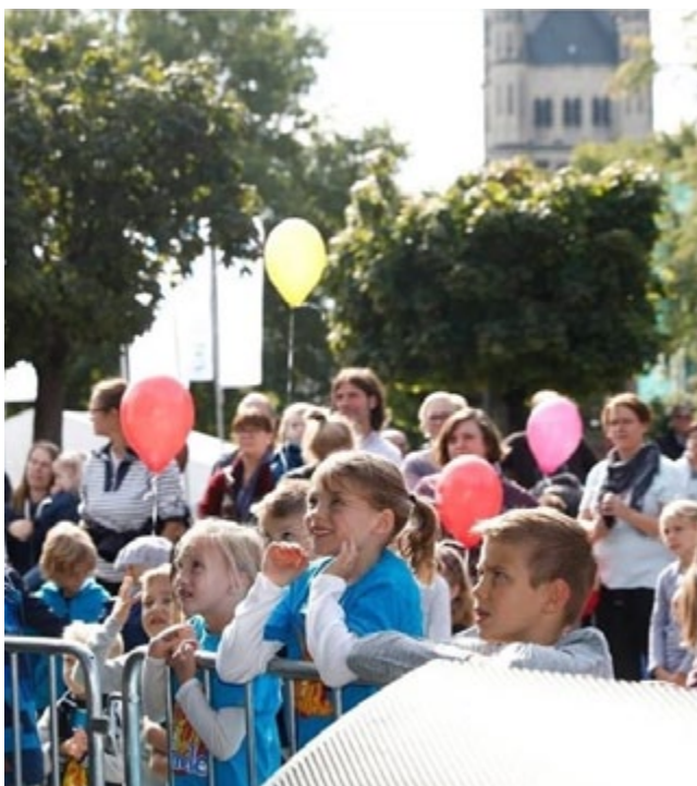
Weltkindertag in Köln

Mit einem großen Familienfest feiert Köln am 22. September 2019 zum 28. Mal den Weltkindertag unter dem Motto „Wir Kinder haben Rechte“. In der Verantwortung des Amtes für Kinder, Jugend und Familien ist der Weltkindertag in Köln ein fester Bestandteil des Engagements für Kinder und ihre Rechte in Köln und Umgebung. Zur Vorbereitung des Weltkindertages fanden mehrere Arbeitsgruppentreffen statt. Kinder aus dem Sozialen Zentrum Lino-Club e.V. aus Köln-Lindweiler brachten in diesem Jahr aktiv Wünsche und Ideen bei einem Arbeitsgruppentreffen ein. Alle Teilnehmerinnen und Teilnehmer berichteten von einem positiven Austausch. Die Kinder werden sowohl die Pressekonferenz als auch die Eröffnung des Weltkindertag-Festes gestalten. Bestandteil des Weltkindertages in Köln ist die große Spiel- und Informationsstraße. Sie wird regelmäßig von mehr als 70 Trägern, Vereinen und städtischen Dienststellen gestaltet. Unter Berücksichtigung des Mottos stellen die Akteure ihre Arbeit vor und laden die kleinen Gäste zu gemeinsamen Aktivitäten ein. Unter großem, teils ehrenamtlichem, Engagement bereiten sich die Organisationen intensiv auf ihre Aktionen und