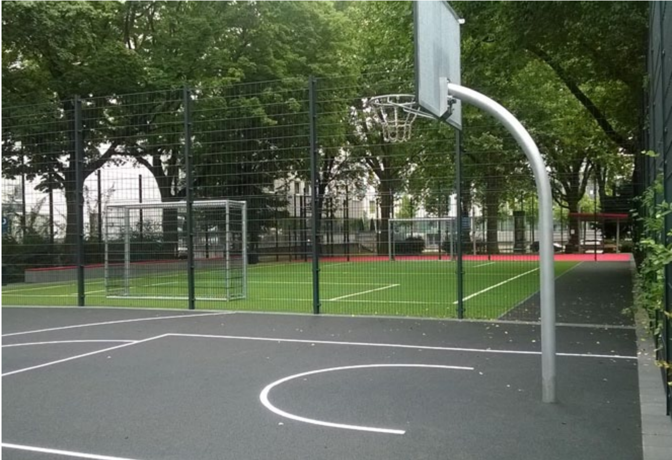
Spiel- und Bolzplatz Holzmarkt