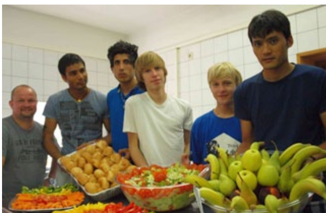
oben: Mädchenkulturtage mit gesundem Snack im Take Five, unten: Kölner Jugendwerkzentrum Geisselstraße in Köln-Ehrenfeld