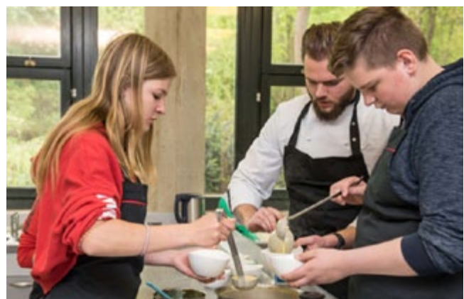
Projekt „Sternekochen an Kölner Schulen – Wertschätzung von Lebensmitteln“