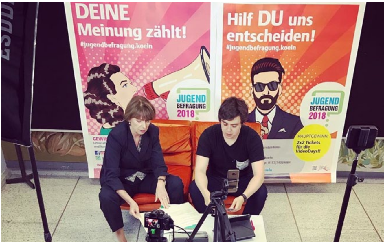
Live-Chat zwischen Jugendlichen und der Oberbürgermeisterin

dungsprogramms für die Mitarbeitenden der städtischen Kindertageseinrichtungen. Im Zeitraum von Dezember 2017 bis Mai 2019 haben sechs mehrtägige Fortbildungen für insgesamt 78 Teilzeit- bzw. Vollzeitkräfte sowie für 38 Leitungskräfte der Stadt Köln zum Themenbereich Partizipation stattgefunden. Die Titel lauteten „Partizipation: Beteiligungskultur im Kita-Alltag leben und gestalten“, „Wer ist hier der Boss? Macht, Ohnmacht und Mitbestimmung im Kindergarten“. Zudem werden von Februar 2019 bis Juli 2019 fünf Teamfortbildungen für insgesamt 70 Teilnehmerinnen und Teilnehmer durchgeführt. Ein Fachtag zum Thema „Kinderrechte“ findet am 18. November 2019 statt.