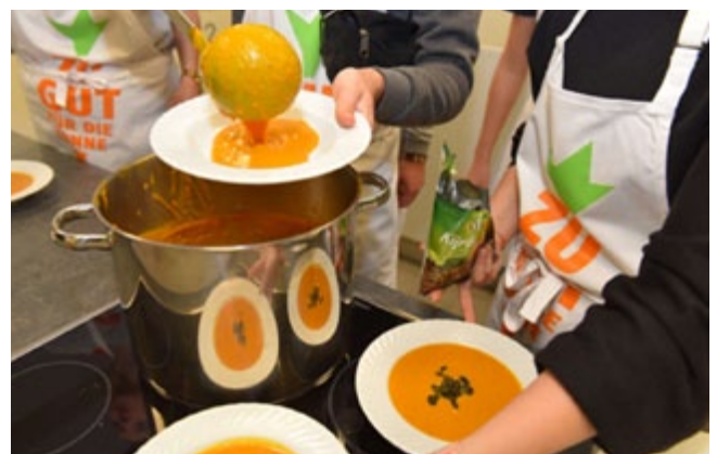
Projekt „Sternekoche an Kölner Schulen – Wertschätzung von Lebensmitteln“