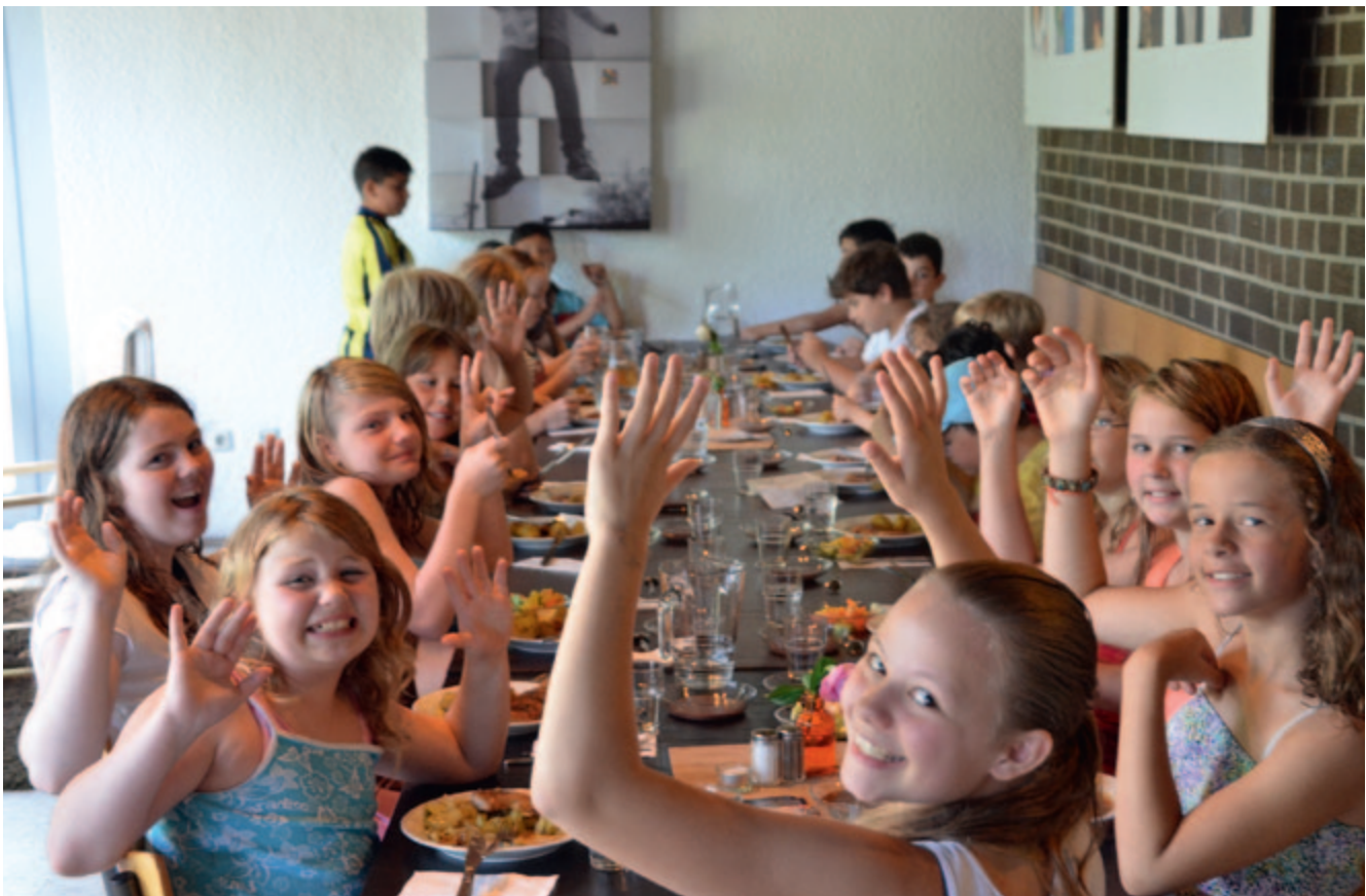
Gesunde Ernährung im Jugendzentrum Glashütte Köln-Porz

Gesundheitsorientierte Jugendarbeit (GoJa) ist ein Programm zur Gesundheitsförderung in Kölner Jugendeinrichtungen. Seit dem Jahr 2006 folgt GoJa den Standards der Bundeszentrale für gesundheitliche Aufklärung (BZgA) gemäß dem „GUT DRAUF“-Zertifizierungs- und Schulungsverfahren. Gesunde Ernährung, ausreichende Bewegung und gezielte Entspannung wirken wechselseitig und werden in den beteiligten Jugendeinrichtungen nachhaltig umgesetzt.