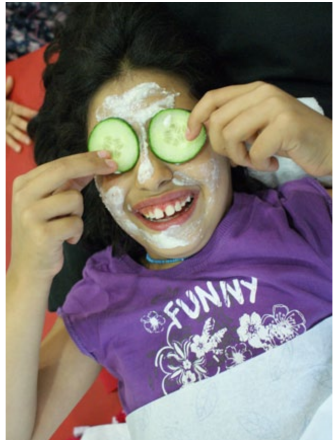
Jugendzentrum Klingelpütz in Köln-Altstadt-Nord