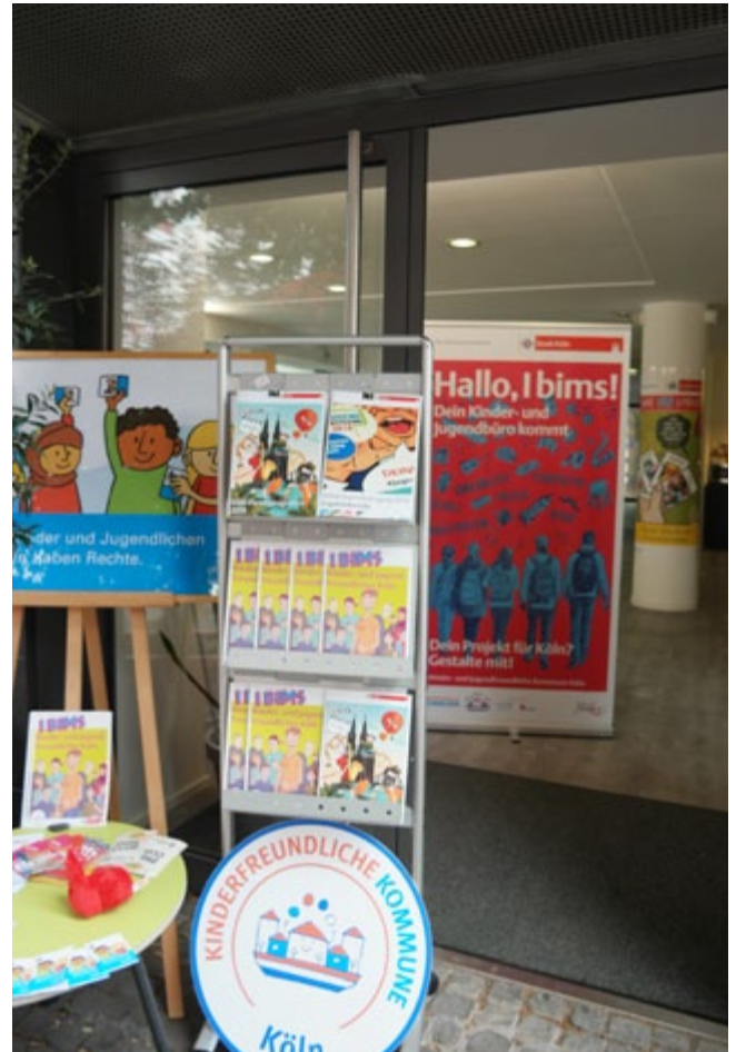
Infomaterial im Kooperativen Kinder- und Jugendbüro

Das Dezernat für Bildung, Jugend und Sport hat das Vorhaben „Kinderfreundliche Kommune“ im Rahmen der Verwaltungsreform zu seinem Leitprojekt für 2018ff erklärt. Daher wird über Fortschritte im Vorhaben zwei Mal jährlich in der Beratung der Oberbürgermeisterin mit dem Stadtvorstand berichtet. Nach Besetzung der Steuerungsgruppe wird dem Rat der Stadt Köln, den Fachausschüssen sowie den Bezirksvertretungen 2020 ein aktueller Sachstandsbericht erteilt werden.