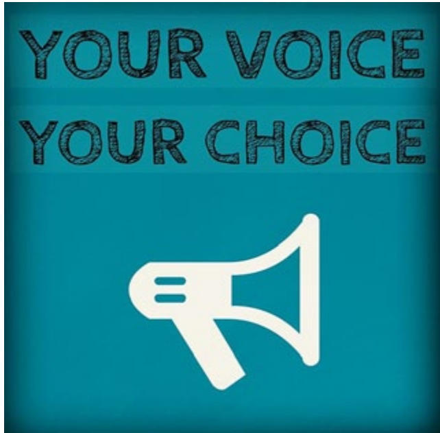
Instagram-Aufruf "YOUR VOICE, YOUR CHOICE"

Um zielgruppenspezifische Beteiligungsmöglichkeiten durch mediale Angebote zu erweitern, wurden im Bereich Social-Media zwei Kanäle entwickelt (Instagram-Kanal, Facebook-Seite), die sowohl allgemein über das Kooperative Kinder- und Jugendbüro als auch über Kinderrechte informieren. Die Inhalte werden durch den offenen Arbeitskreis Partizipation, der sich aus Jugendlichen, unter anderem der Bezirksschülervertretung, den Jugendverbänden als auch unorganisierten Jugendlichen zusammensetzt, monatlich unter Federführung des Kölner Jugendrings e.V. abgestimmt. Unter dem Slogan „YOUR VOICE, YOUR CHOICE“ werden Kinder und Jugendliche dazu aufgerufen, ihre Anliegen über den Social-Media-Kanal zu streuen und diesem Gehör zu verschaffen. Langfristiges Ziel soll es sein, dass die Betreuung der Social-Media-Kanäle durch Jugendliche erfolgt.