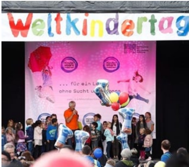
Weltkindertag in Köln

Präsentationen vor. Ein Flyer informiert über die Angebote. Darüber hinaus haben lokale Medien zugesagt, über den Weltkindertag in Köln zu berichten. Alles Wissenswerte finden interessierte Kinder und Erwachsene auch unter der Internetadresse. Darüber hinaus ist eine Werbeaktion mit bunten City-Light-Plakaten geplant.