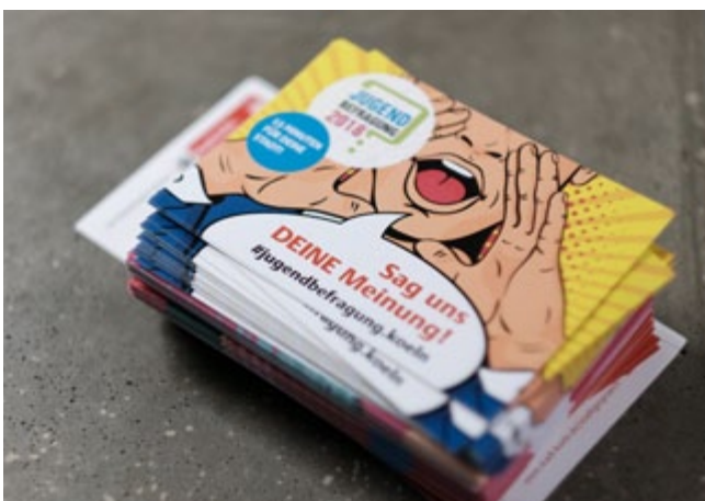
Kampagne zur Jugendbefragung 2018