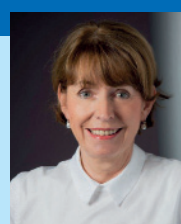
Henriette Reker Oberbürgermeisterin der Stadt KÖLN

„Die Zukunft der Kinder und Jugendlichen – und damit die Zukunft Kölns – hängt entscheidend davon ab, dass sie von klein auf die Zuwendung, Unterstützung und Förderung erfahren, um ihre Zukunft selbst gestalten zu können. Und das unabhängig davon, in welchem Umfeld sie aufwachsen. Daran arbeiten wir tagtäglich. Ich unterstütze und begleite den Prozess, Inhalte und Strukturen in der Stadtverwaltung als Querschnittsthema weiter zu entwickeln. Kinder und Jugendliche sollen ihre Ideen einbringen und partizipieren können, immer dann, wenn es um ihre Belange geht.“